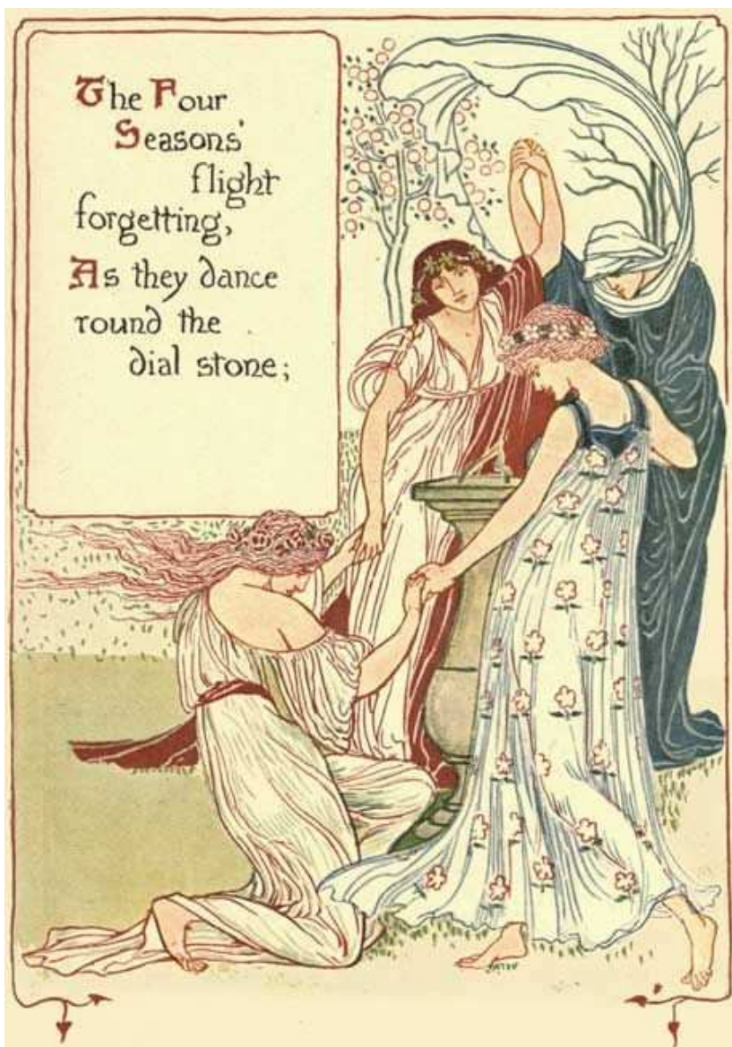
The Four Seasons, di Walter Crane